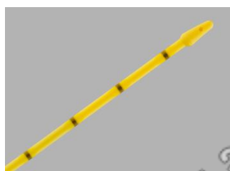
Cateter Ureteral Ponta Cone